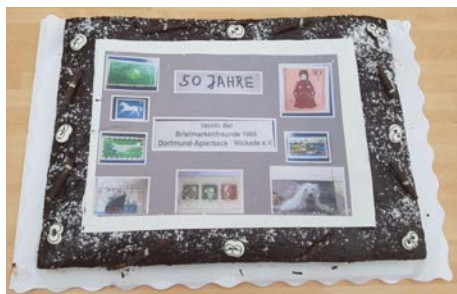
Geburtstagskorte zum Vereinsjubiläum