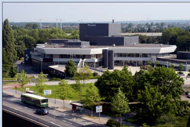
Veranstaltungsort ist das Forum in Leverkusen

2. April 2017: Verbandstag Philatelisten in Nordrhein-Westfalen - Oskar Erbslöh (1879 bis 1910), Luftschiffpionier.