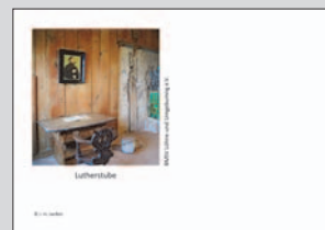
Umschlag mit Lutherstube